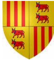
Blason du Béarn