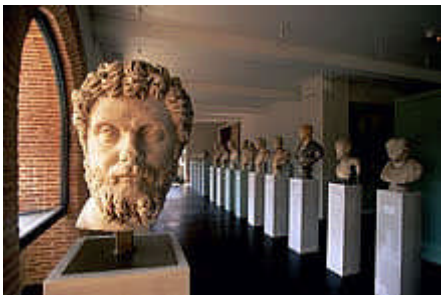
Museo de las Antigüedades

Ubicado desde 1892 en un monumento histórico, próximo a la basílica Saint-Sernin. El museo Saint-Raymond es conocido en el mundo entero por su excepcional colección de esculturas romanas. Un fondo que proviene sobretodo, de la suntuosa villa de Chiragan de Martres-Tolosanes y que constituye el mayor conjunto de esculturas romanas de mármol encontrado en Francia en un solo lugar. De una gran diversidad, esta colección consta, por ejemplo, de los relieves de los Trabajos de Hércules, medallas de dioses, réplicas de obras de arte de la estatuaria griega, una extraordinaria galería de emperadores